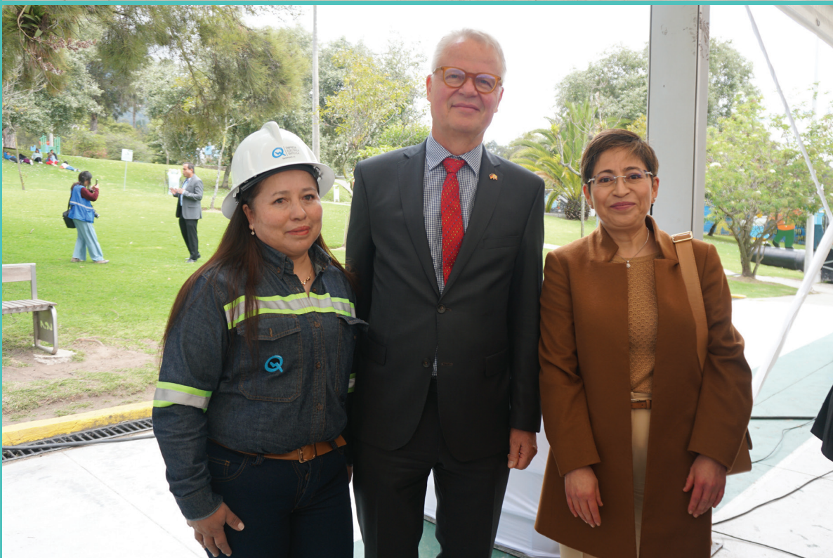
Entrega de las placas de Instituciones Seguras, realizado el 14 de marzo de 2024, en el Parque de la Mujer, con la presencia de la Ministra del Interior, Ministra de Trabajo y el Embajador de Alemania, como las principales autoridades.